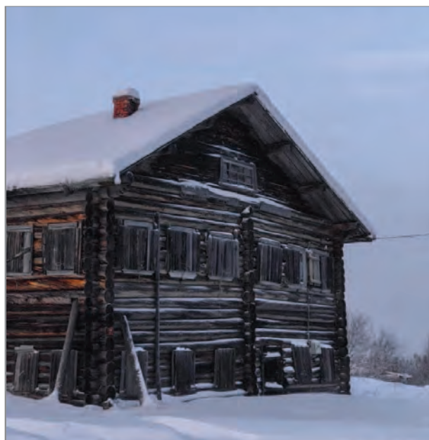
Неприкаянный дом без коня, деревня Кулой