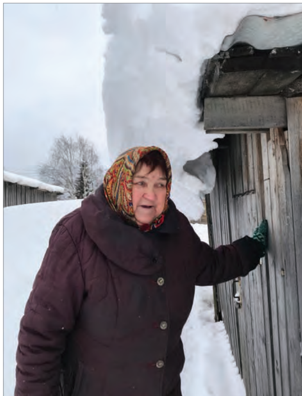
Бабье горе – сугробы свисают с крыш