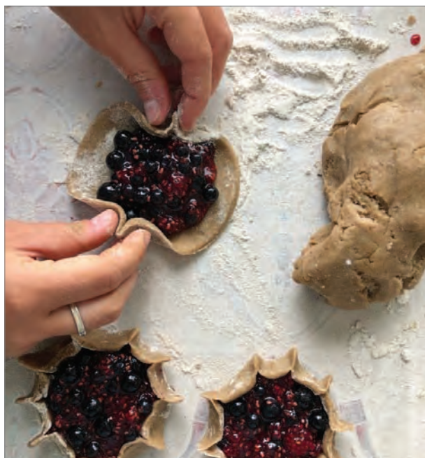
Нежilое тесто – калитки на ржаной муке