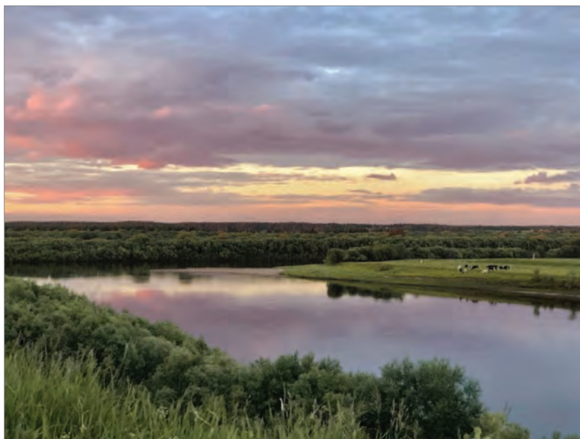
Река Пинега в белую ночь

Нет такого языка — пинежского, не составить его словарь. Но речь пинежскую не спутаешь, если раз услышишь. Особенно, если она озвучена женскими голосами. Каждая жёнка — со своей судьбой, своим голосом. Потому и говоря своя выходит.