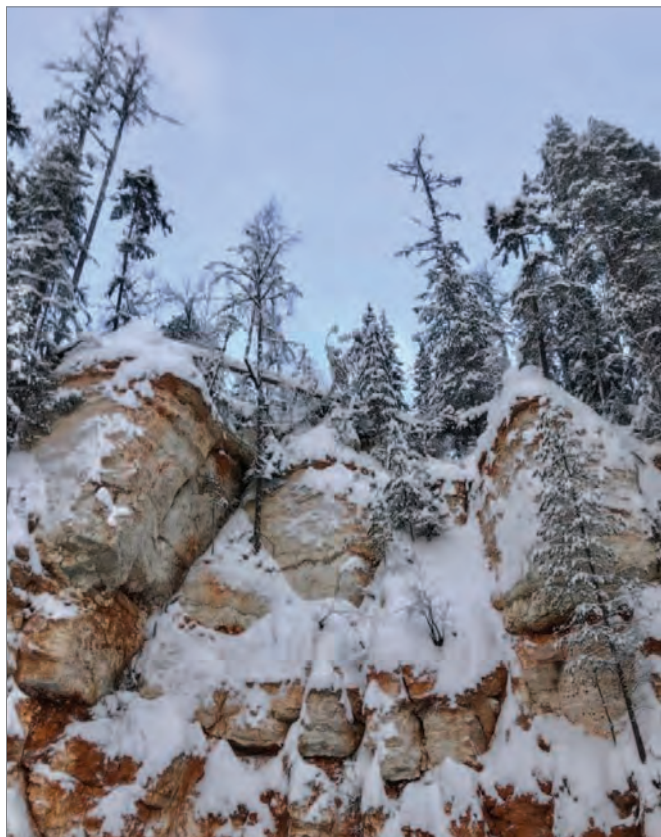
Пинежские пещеры. На пещере стоит и деревня Кулогоры