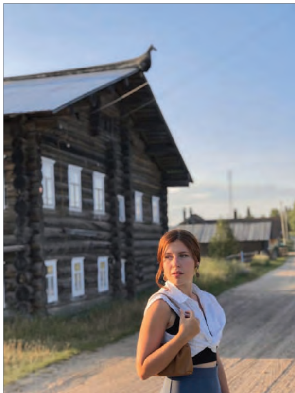
Дом с конем. Веркола, родная деревня писателя Федора Абрамова.