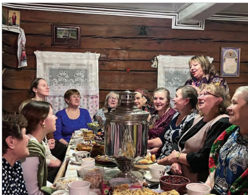
Деревня Веркола поёт. Застолье