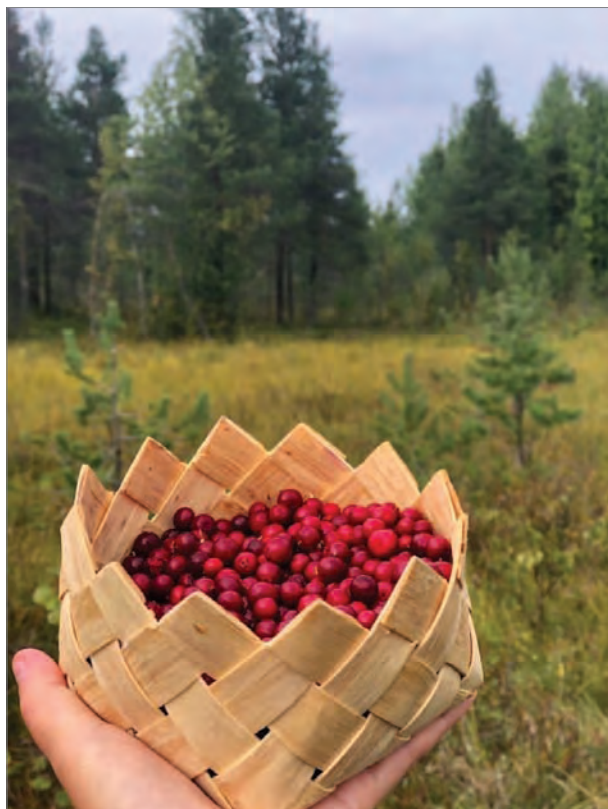
Брусника с беломошника