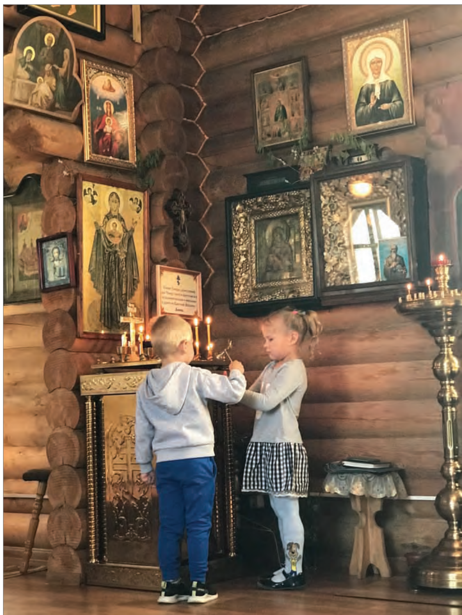
Юные прихожане в часовне Троицы Живоначальной, что построена на месте взорванного Свято-Троицкого собора