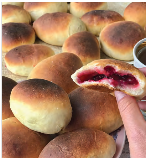
Жилое тесто – дрожжевое