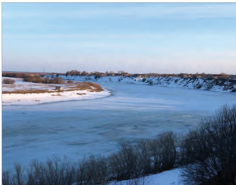
Пинега-река накануне ледохода