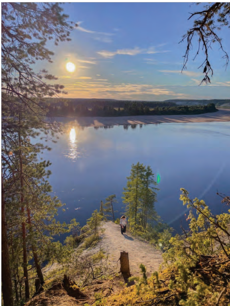
Над рекой Пинегой