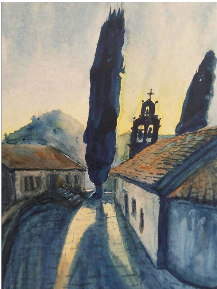
Кипарисы у храма Святого Архангела Михаила. Акварель