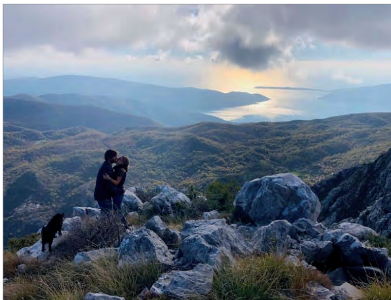
Где-то в поднебесье