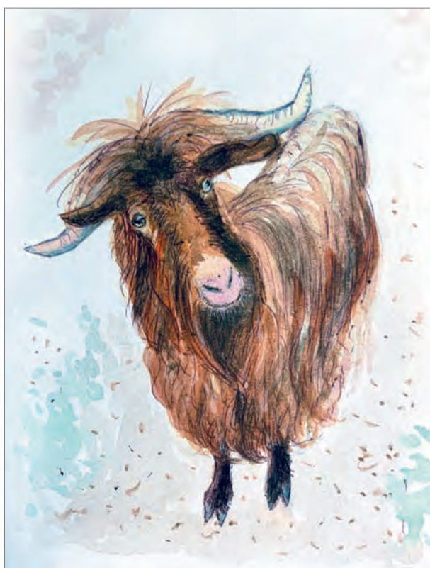
Козёл Сокол. Акварель