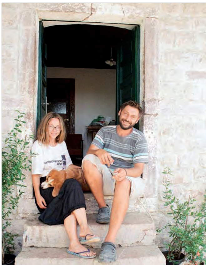
В самом прекрасном месте на Земле рядом с Серджаном