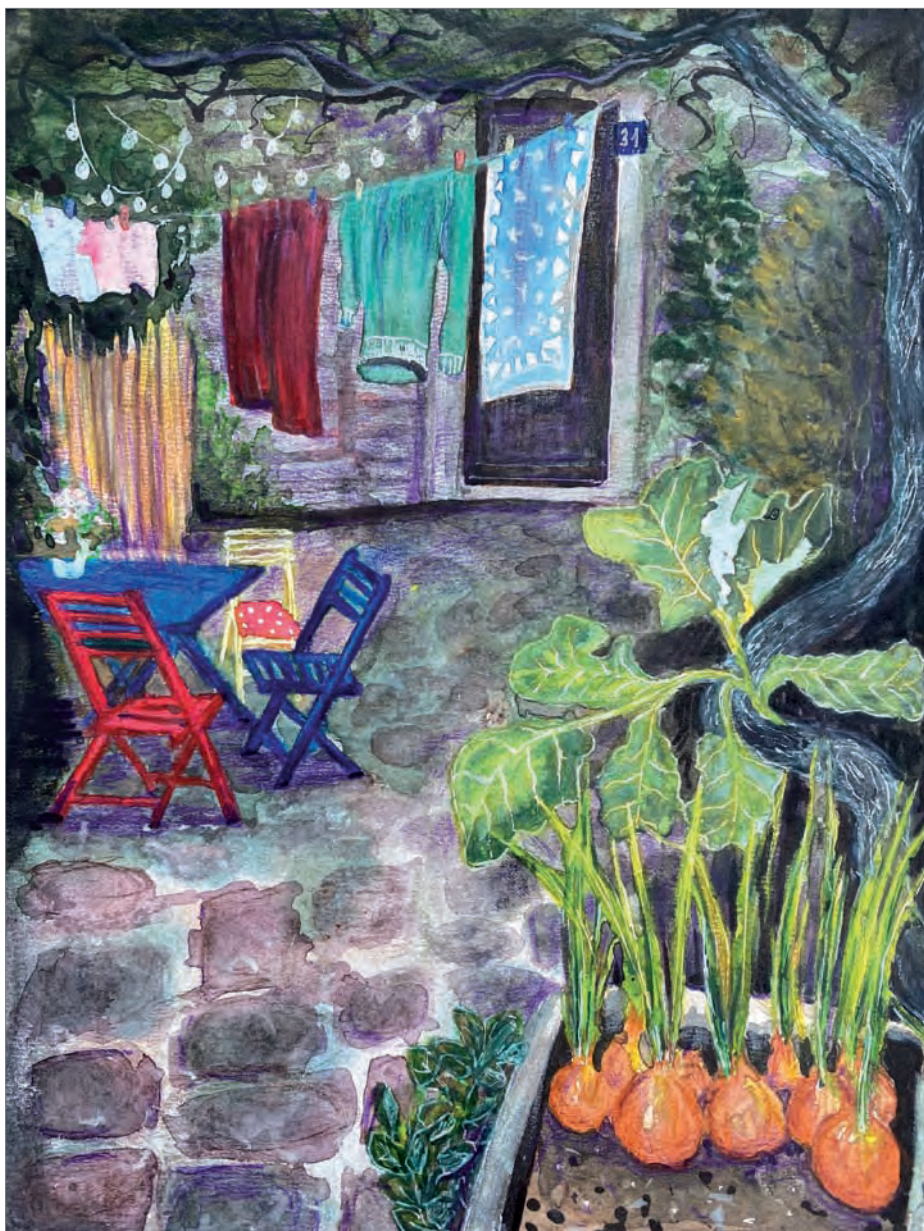
Дворик в Каменари. Смешанная техника