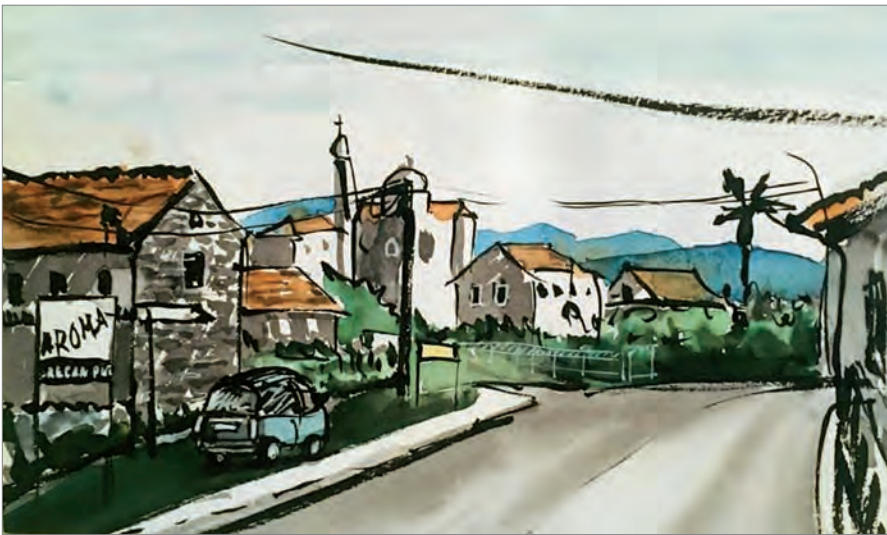
Посёлок Радовичи. Акварель