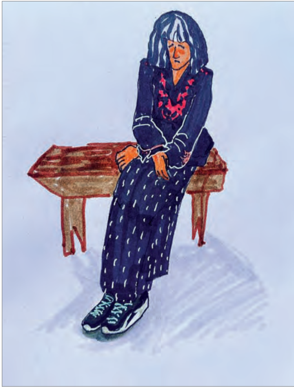
Нарядная Боса. Маркеры