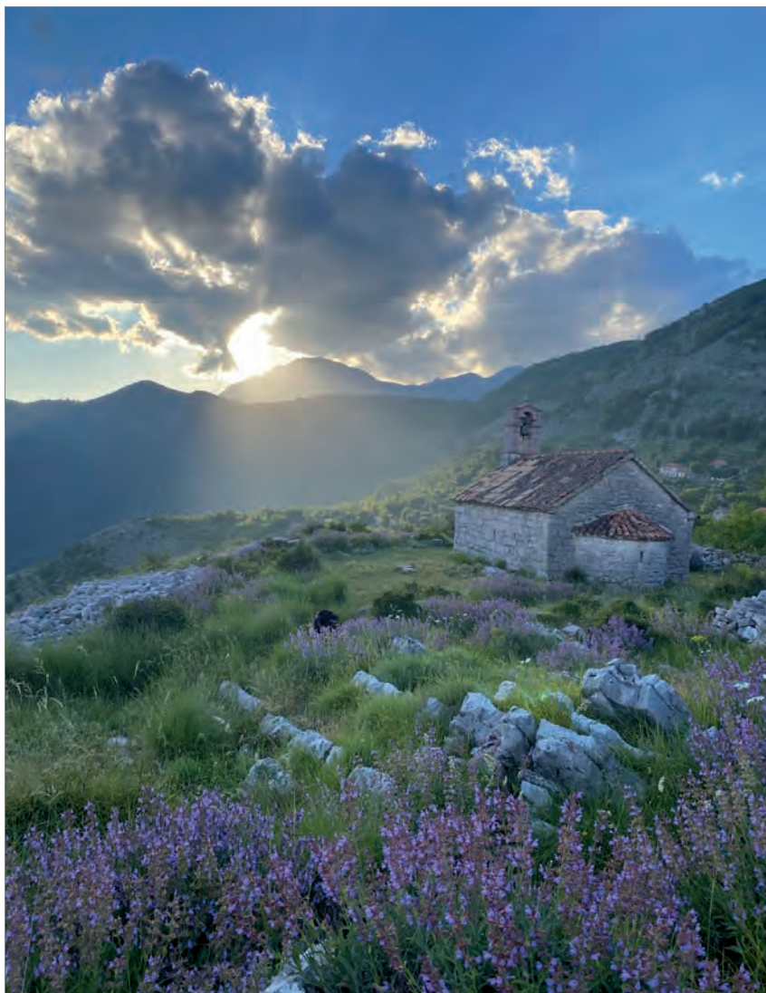
У церкви Святой Теклы зацвёл шалфей